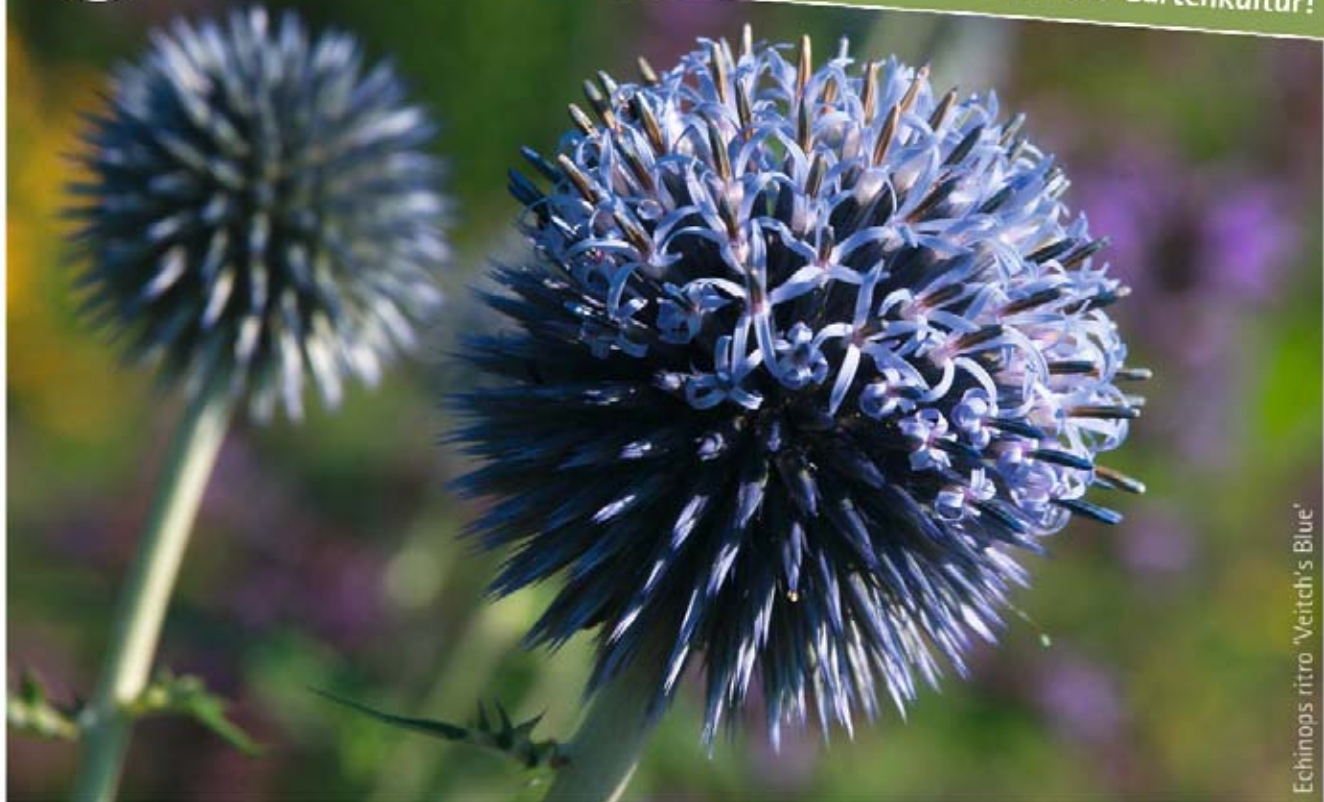
Echinops ritro 'Veitch's Blue'

Workshops, Führungen, Gartenmärkte, Feste, ... Besuchen Sie auch das Museum der Gartenkultur!