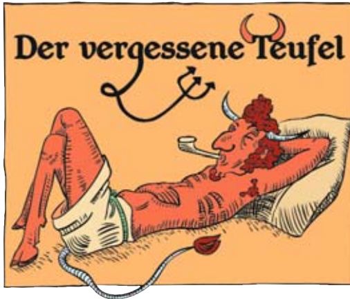
Nach der satirischen Komödie „Das sündige Dorf oder Der vergessene Teufel“ von Jan Drda.

Zwischen Faschingsdienstag und 14.30 Uhr: Die höllische Chefetage ist in Aufruhr – seit vielen Jahren vermeldet Illertalhausen keinen Neuzugang mehr. So wird der nach modernsten Methoden der experimentellen Psychologie arbeitende Ichthuriel dorthin geschickt, um nach dem Rechten zu sehen, das heißt, wieder ein sündiges Dorf aus Illertalhausen zu machen und den zuständigen Teufel dort zu suchen. Der wiederum hat gar keine Lust mehr, böse zu sein, sondern verliebt sich in die forsche Euphrosine, die Witwe des Totengräbers. Die Leute aus dem Dorf – der Schmied und seine Frau, sein Geselle und dessen Freundin, der Mesner, die Totengräberwitwe und die Müllerswitwe, die Pfarrer und die Mädchen – geraten in den Wirbel des Streits, den Ichthuriel anrichtet, um die Leute wieder böse zu machen. Wer wird ihm widerstehen können?